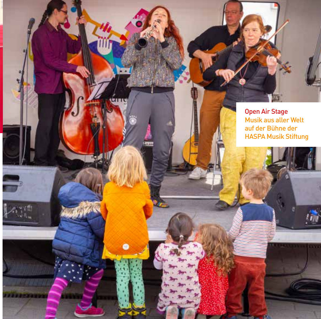
Open Air Stage Musik aus aller Welt auf der Bühne der HASPA Musik Stiftung